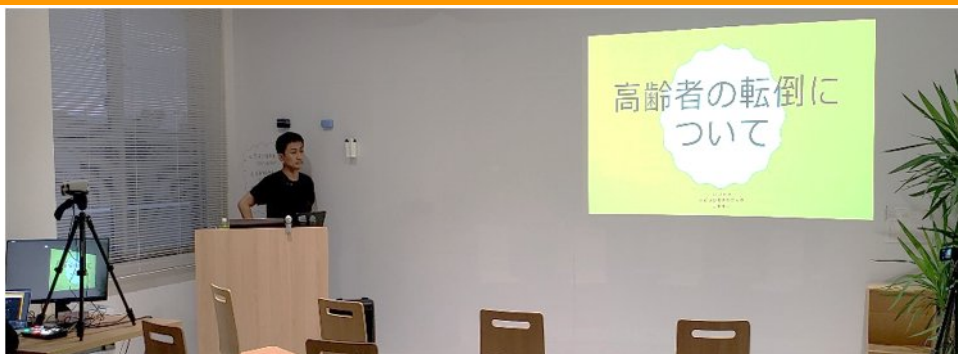
(オンデマンド配信収録の様子)

佐賀県知的障害者福祉協会（事務局：県社協）では、オンデマンド配信による「令和3年度保健衛生部会研修会」を開催しました。（配信期間：10月18日（月）～10月29日（金））