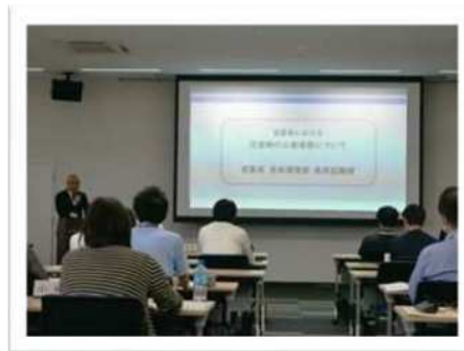
〔三者連携の重要性についての説明に、真剣に耳を傾ける参加者〕

5月29日(水)に「災害ボランティアに関する情報共有会」を開催しました。▶これは、災害時にボランティア活動を通じた被災者支援を効果的かつ円滑に実施することができるよう、市町行政と社協の連携を強化するために例年開催しているものです。▶当日は、佐賀県県民協働課からは、災害時の各市町行政・社協〔災害ボランティアセンター(以下「災害VC」)〕・CSOの三者連携の重要性や被災者支援の調整におけるポイントを、本会からは災害VCの役割と機能等について、それぞれ説明しました。また災害時、活動を希望されるCSO等の調整役をう佐賀災害支援プラットフォーム(SPF)から、本県で過去に発災した際の取り組みも含めてSPFの活動内容について報告いただきました。▶今後も、災害時に効果的な被災者支援を実施できるよう、平時のうちから、行政やCSO等関係団体との顔の見える関係づくりや発災時の情報共有手段の確認、また災害ボランティアの活動内容に関する共通理解を図るなどの被災者支援活動の体制を強化します。