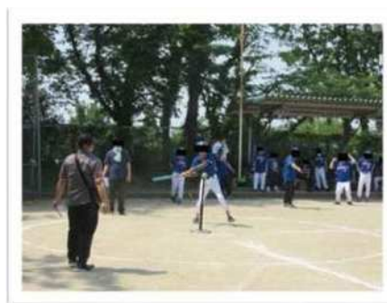
〔ティーボールを楽しむ施設利用者と声援を送るチームメンバーの様子〕

佐賀県知的障害者福祉協会(事務局:県社協)では、5月25日(土)に佐賀市立大和中央公園自由広場にて、佐賀県知的障害者施設親善球技大会(ティーボール)を開催しました。▶この大会は、県内の知的障害児者施設の利用者代表選手が集まり、ティーボールを通じて、生活意欲の向上と参加選手の交流を深めるために毎年開催しています。▶当日は晴天に恵まれ、県内各施設から6チーム、計122名が参加しました。▶競技中には、選手同士の掛け声や大きな声援が飛び交い、大いに盛り上がりました。▶優勝チームは、10月に福岡県で開催予定の九州大会に出場します。頑張ってください!